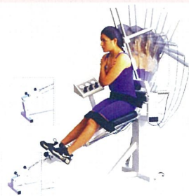
藉由主動運動訓練來強化該群肌肉力量，改善疼痛問題

姿能訓練椅其最大特色是提供主動運動，可固定在脊椎任一節或在二節脊椎上，並設定各種程度的阻力以達到訓練效果。也可適用一些行動不便的病人，可搭配減重懸吊，在物理治療師之指導下使病患得到恢復的機會。