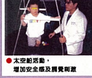
● 太空船活動，增加安全感及觸覺刺激