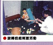
● 旋轉前庭刺激活動