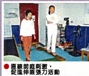
● 提供伸展活動，促進伸展力活動

孩童天真可愛，不僅是父母的一塊寶，也是國家未來的主人翁，而感覺統合治療針對這類孩童，幫助他建立基礎的學習能力，基於『有良好的感覺統合功能，才能奠定日後學習基礎』特別強調『9歲以前神經生理可塑性最高』。及早幫助孩子，經驗告訴我們這類孩童將來也會有很大的成就。