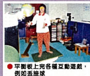
● 平衡板上完成各種互動遊戲，例如丟接球