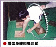
● 增進身體知覺活動