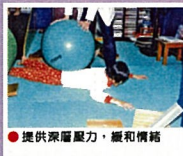
● 提供深層壓力，緩和情緒